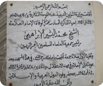
Keçova Camisi nin kitabesi

Bu müzede eskiden yönetim kademesindekilere ait bir evmiş. Müzede Cezayir'in tarihi süreci, kültürel değerleri ve tarım ürünlerinin saklanması hakkında bilgileri içeren eserler bulunuyor. Şimdi Kasba bölgesindeki gezimizin en önemli kısmına geliyoruz.