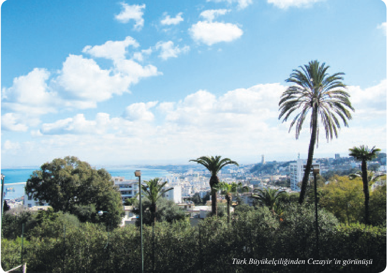
Türk Büyükelçiliğinden Cezayir'in görünüşü

Eğer Keçova Camisini görmeden dönerseniz o gezinizi olmamış saymalısınız.