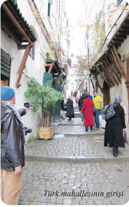
Türk mahallesinin girişi

evin çatısından kuş bakışı Kasba bölgesini ve eski limanı seyrediyoruz. Evin çatısından Barbaros'un restorasyon halindeki sarayının fotoğraflarını çekiyoruz ve gezimize devam ediyoruz.