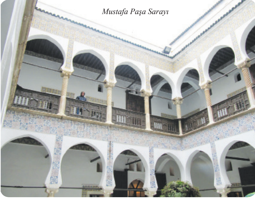
Mustafâ Paşa Sarayı