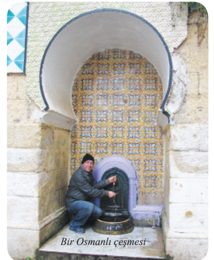
Bir Osmanlı çeşmesi