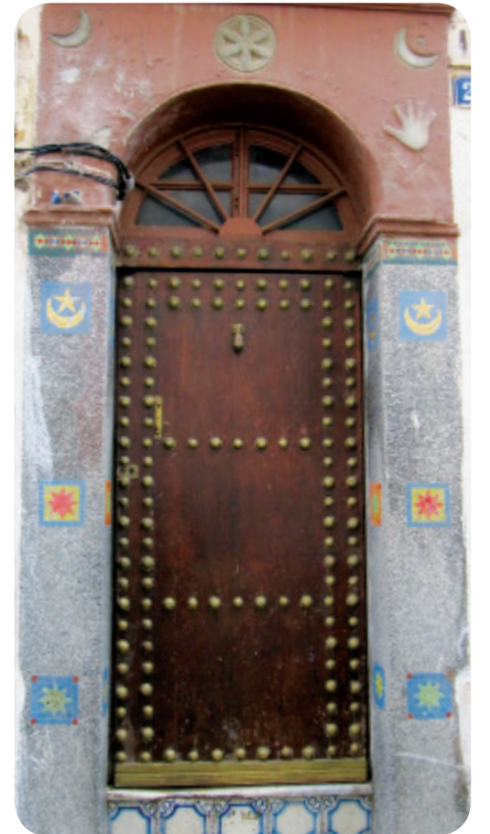
Türk mahallesindeki ay-yıldızlı ev kapısı

her bölgesinde olduğu gibi Kasba bölgesinde de yoğun restorasyon faaliyetleri var. Bunlar bitince Kasba bölgesinin Akdeniz’in en güzel eski mimariyi bulunduran bölgelerinden birisi olacağı kesindir. Yanımızda Cezayir polisleri güvenlik önlemleri alıyorlar. Öncelikle Türk Mahallesi ve Türk evini geziyoruz. Burada ay-yıldız damgalı kapılarda fotoğraflar çekiyoruz ve beş katlı bir Türk evini geziyoruz. Bu