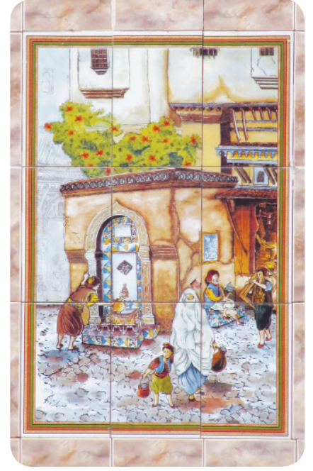
Caddelerdeki duvar süslemeleri

Burada Cezayir'de pek çok müridi olan bir tarikat şeyhinin türbesini ziyaret ediyoruz. Türbede dua eden, namaz kılan Cezayirlileri görüyoruz. Bu arada türbeye yemekler geliyor. Rehberimiz her gün burada fakirlere yemek verildiğini söylüyor. Türbe bölgede çok önemli bir ziyaret yeridir. Görevli Türbedeki büyük avizenin İngiltere Kraliçesi Viktoria'nın hediyesi olduğunu söylüyor. Kraliçenin bu türbede dua ettikten sonra çocuğu olduğu için onun hatırasına bu avizeyi tür-