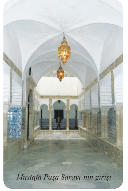
Mustafâ Paşa Sarayı'nın girişi

Okulu gezdikten sonra şimdi müze olarak hizmet veren Osmanlı dönemi yöneticilerinden Mustafa Paşa'nın Sarayını gezmeye gidiyoruz. Saray girişinde misafirlerin beklediği geniş bir alan bulunuyor. Buradan iç avluya giriliyor.