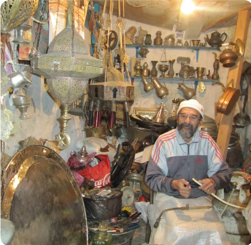
Ay-yıldızlı lambalar satan Cezayirli satıcı

Öyle ya da böyle sonunda güzel bir eser ortaya çıkmış.