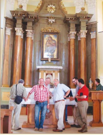
Karlofça Anlaşmasının yapıldığı masa