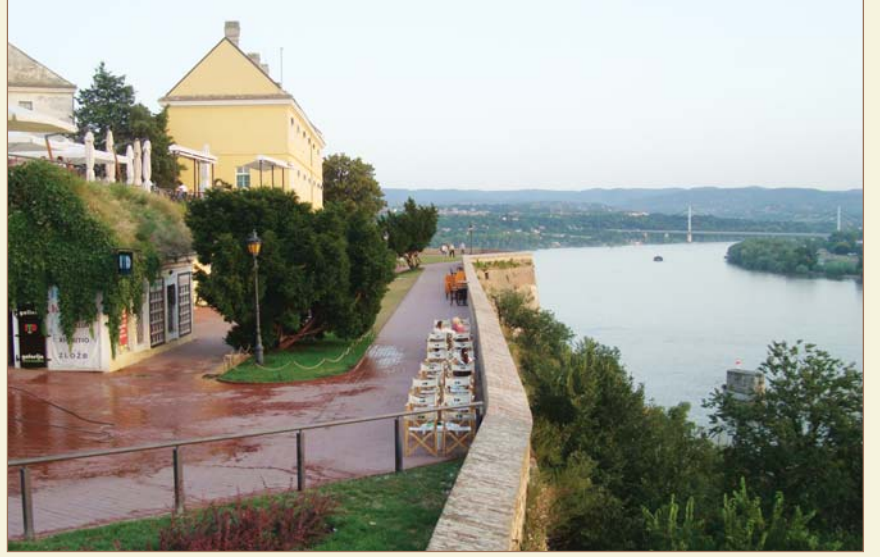
Novisad (Petervaradin) Kalesi ve Tuna Nehri