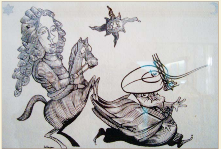
Zenta Müzesinde Osmanlı Türk askerlerini küçük düşürücü resimlerden biri