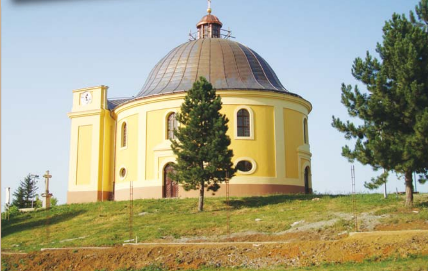
Karlofça Antlaşmasının yapıldığı çadır yerine yapılan şapel (şu anda müze)