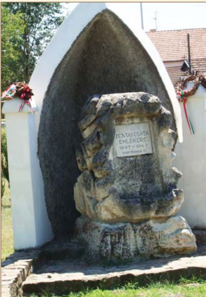
Zenta Savaş Anıtı

Zenta Savaşı'nda Osmanlı üçüncü kez bir Sadrazamı, Elmas Mehmet Paşa'yı şehit vermiştir. Zenta kenarındaki Tuna'nın kolu TİSA nehri üzerine bir köprü yapılır ve ordunun çoğu geçer. Sadrazam Elmas Mehmet Paşa ve kalan 7 bin kişi ile savunmaya devam edilir. Bu arada orduda bir bozulma başlar. Elmas Mehmet Paşa her ne kadar önlemeye çalışsa da başaramaz. Sonunda Elmas Mehmet Paşa maalesef bozulan kendi askerlerimiz tarafından şehit edilir. İnebolu'lu çok yiğit bir insan olan Sadrazam Elmas Mehmet Paşa'nın şehadeti moralleri daha da bozar ve Zenta savaşı kaybedilir.