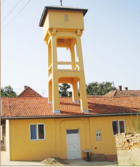
Silankamen Türk Hamamı