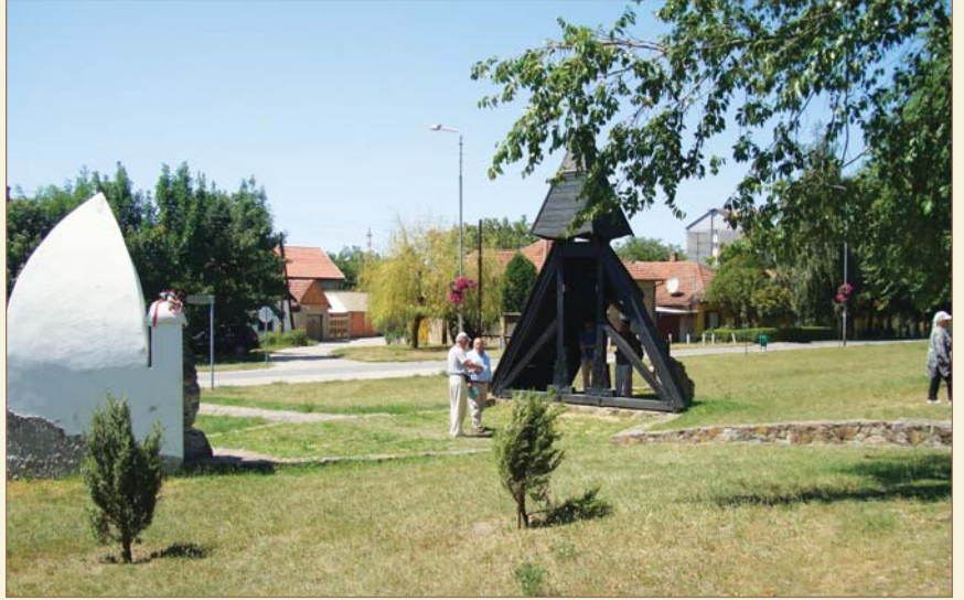
Zenta Harbinin geçtiği bölge

Novisad'tan sonra ki durağımız Zenta. Buranın Türk tarihinde önemi büyüktür. 1697 Zenta Savaşı burada olmuş, ordumuz bozguna uğratılmıştır ve Sadrazam Elmas Mehmet Paşa burada şehit edilmiştir. Zenta bozgunu pek çok nedenle, Bosna coğrafyasında uzun süre sıkıntı yaşanmasına yol açmıştır. Bu coğrafya tarihimizde hep hüznü olaylarla hatırlanmaktadır. Bu olayların ilki 1683 Viyana bozgunudur ve Balkan tarihinde dönüm noktasıdır. Bundan hemen sonra 1686'da 145 yıl bizim olan Budin (Budapeşte) elimizden çıkmıştır. Budin'in düşmesi tüm Osmanlı coğrafyasında çok büyük üzüntü yaratmıştır. İstanbul'da " Aldı Nemçe bizim nazlı Budin'i " diye şarkılar bestelenmiştir. Budin'de son savunmayı Arnavut Abdurrahman Abdi Paşa yapmış ve Başta Arnavut Abdurrahman Abdi Paşa olmak üzere, bir tek gazi olmaksızın, Osmanlı ordusunun tümü burada şehit düşmüştür. Bunları iyi tahlil etmeliyiz. Türk tarihi at gözlükleri ile değil derinliklerine inilerek incelenmeli ve dersler çıkarmalıdır. Budin'den son-