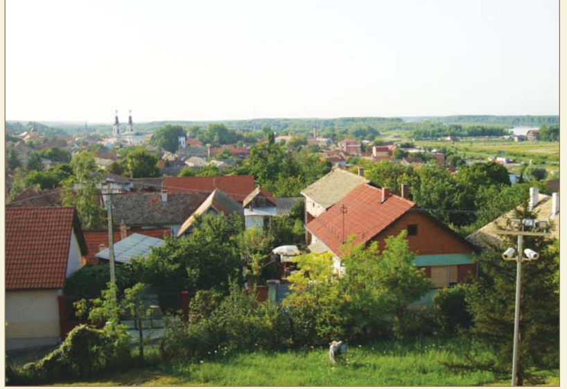
Karlofça Kasabası - Tuna kenarı