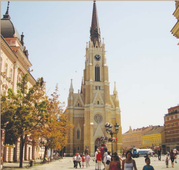
Novisad Şehir Merkezi

Gece de kale içi otelinde konakladık. Güzel bir kahvaltı sonrasında Novisad şehir merkezini dolaştık. Eski şehir merkezinin mimari özelliğinin aynen korunduğunu gördük ve şaşırдық. Bizde olsa çok şey yıkılmış ve yerini blok apartmanlar almış olurdu. Eski şehir meydanının etrafında pek çok kilise ve bu kiliselerin yanlarında da yemek yenilebilecek yerler ve kahvehaneler sıralanmıştır. Bir yandan bir şeyler içerken, diğer yandan şehrin güzelliklerini seyre daldık. Novisad şehir merkezindeki bazı dükkanlarda kaymak, ayran, piliç, burek, berber